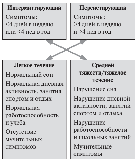
Рис. 4. Классификация АР (ARIA, 2001, 2008).

нижних дыхательных путей также имеют больше сходных черт, чем различий. Концепция единства дыхательных путей основывается на анатомической связи носа и легких, общности дыхательного эпителия, наличии назобронхиального рефлекса, что в конечном счете обуславливает одинаковые патофизиологические изменения в слизистой носа и бронхов после провокации специфическим аллергеном [15, 16]. Нарушение функций верхних дыхательных путей при АР, прежде всего дыхательной и защитной, неизбежно приводит к нарушению функций нижних дыхательных путей, а блокада носового дыхания способствует увеличению контакта нижних дыхательных путей с сухим холодным воздухом и аллергенами. Поэтому закономерно, что при наличии симптомов АР у пациентов, страдающих БА, увеличивается частота приступов БА, незапланированных визитов к врачу, обращений за неотложной помощью, госпитализаций и повышается потребность в глюкокортикостероидах (ГКС) (рис. 3) [17]. В исследовании, проведенном в Великобритании, было выявлено, что у больных БА в сочетании с ринитом БА имела неконтролируемое течение в 4–5 раз чаще, чем у пациентов с изолированной БА [18].