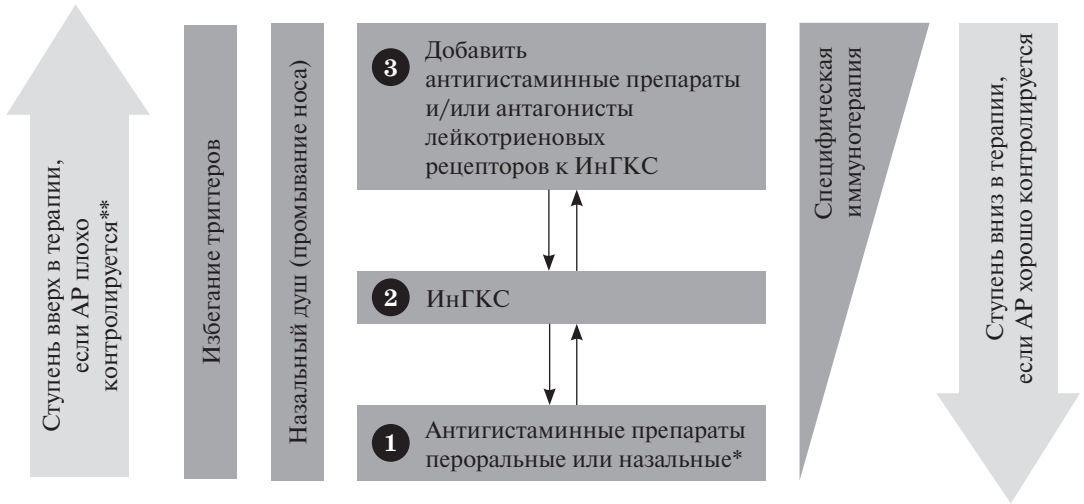
Рис. 5. Терапия АР. 1, 2, 3 – терапия в зависимости от тяжести симптомов АР. * Пероральные антигистаминные препараты могут лучше переноситься, но топические имеют более быстрый эффект. ** Пересмотреть диагноз, если заболевание не контролируется в течение 1–2 нед. ИнГКС – интраназальные ГКС.

ков, страдающих персистирующей БА и получающих ингаляционные ГКС (ИГКС) , было продемонстрировано, что контроль БА, оцениваемый с помощью опросника по контролю над астмой (Asthma Control Questionnaire, ACQ), был значимо хуже, а уровень оксида азота в выдыхаемом воздухе значимо выше у пациентов, страдающих помимо БА аллергическим ринитом [19].