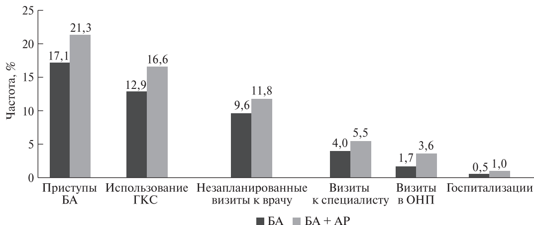
Рис. 3. Частота приступов БА и обращений за неотложной помощью у больных БА и у пациентов с сочетанием БА и АР [17]. ОНП – отделение неотложной помощи.

Частота ассоциации аллергической БА с АР составляет >80%. Аллергический ринит является независимым фактором риска развития БА, увеличивающим шанс заболеть БА более чем в 3 раза (рис. 2) [14].